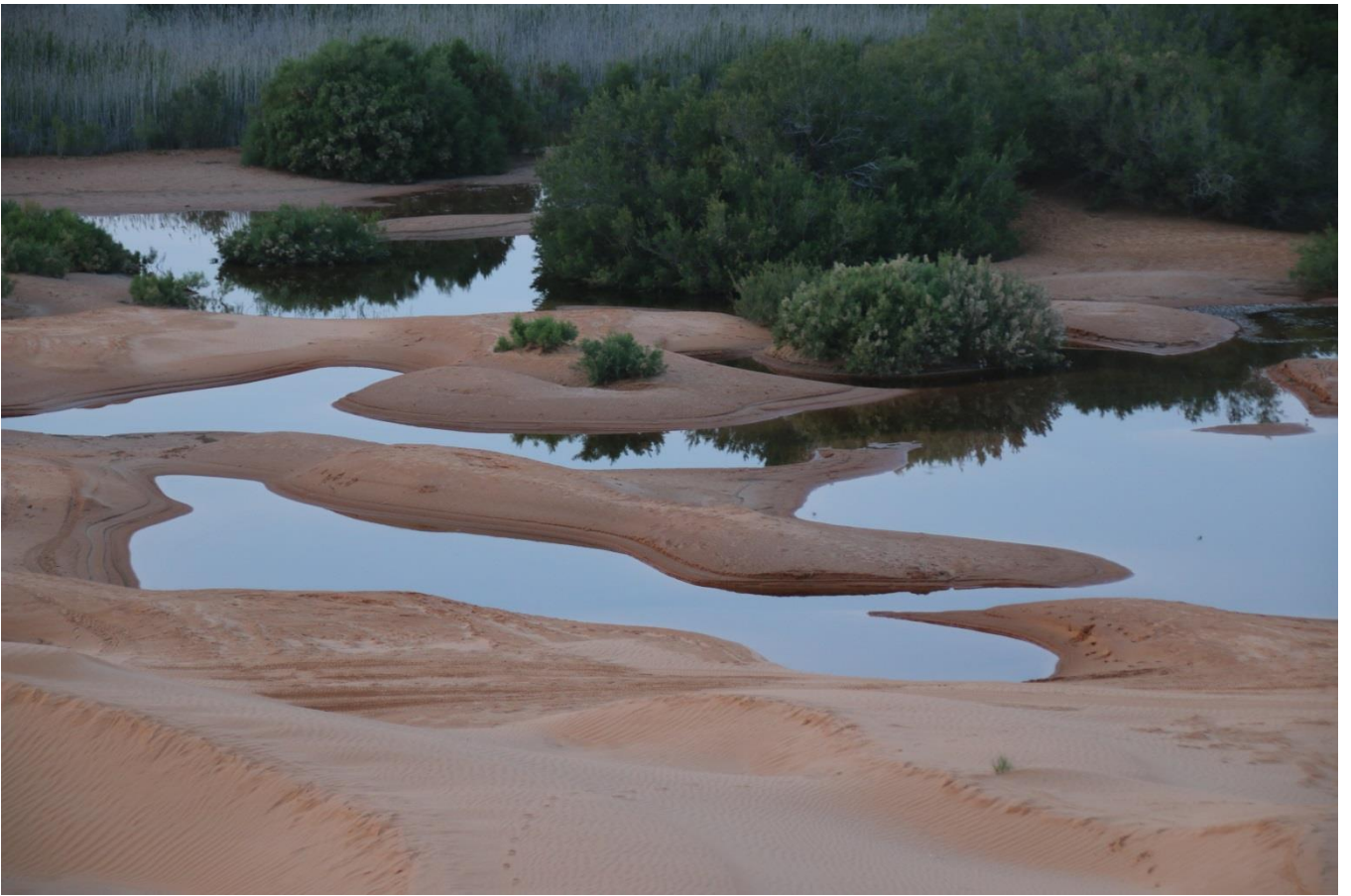
auch das ist die Wüste...