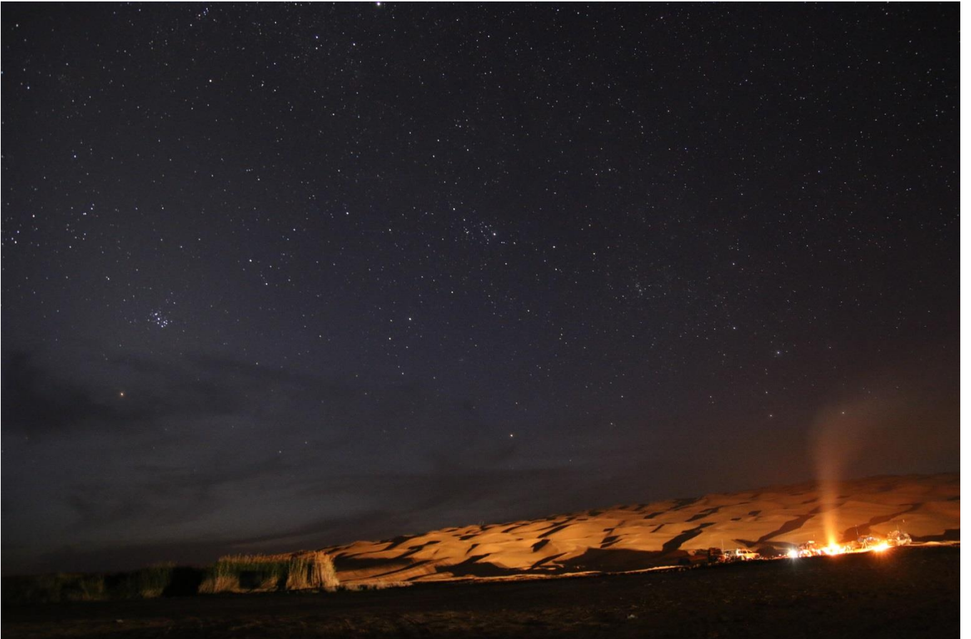
Lagerfeuer unter dem Sternenhimmel